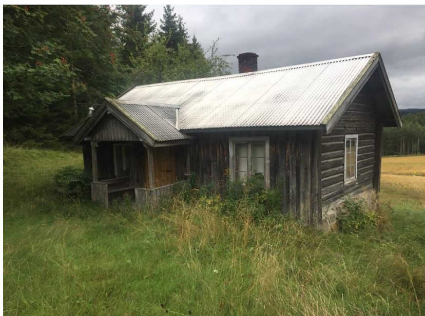
Husmannsplassen, Hjørnet på Lillehov