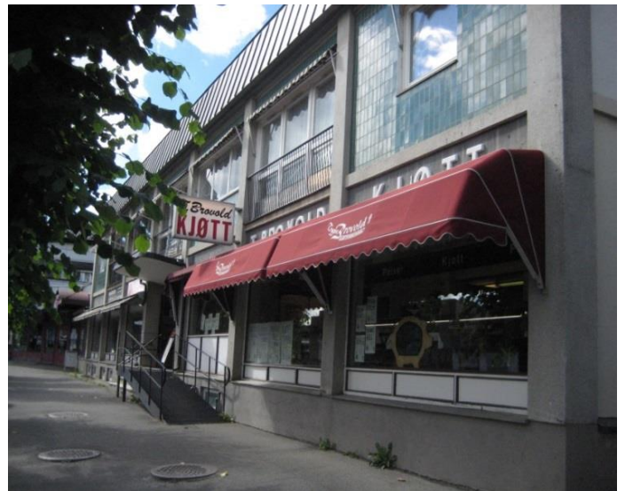
Brovold kjøtt i Stangebyen er en typisk sentrumsbygning fra 60-tallet. Forretningen har en vesentlig lokalhistorisk verdi og bruksverdi. Men bygningen og dagens drift gir også et nostalgisk og unikt innblikk i tradisjonell og spesialisert vareutsalg, som var typisk i bysentrum før kjedebutikkernes tid.

Jamfør de nasjonale målene for kulturminneforvaltning forventes det ikke at man skal ta vare på alt. Det må gjøres et systematisk utvalg. Dette er ikke bare viktig med tanke på bevaring av kulturminner, men et godt utvalg er også vesentlig for å avgjøre hva man ikke skal ta vare på. Samfunnet endrer seg stadig, og utvikling og utbygging er nødvendig og ønskelig. Særlig i tettsteder og knutepunkt er utbyggingspresset stort. Nettopp av den grunn vil et godt arbeid rundt utvalg av kulturminner bli sentralt slik at vern ikke går på bekostning av nødvendig utvikling,