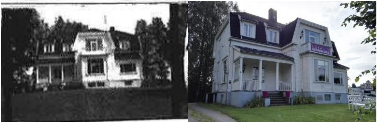
Fotografering ble gjort ifm. SEFRAK-registreringer i Stange kommune på 70- og 90-tallet. Den planlagte kulturminneplanen vil bidra med et stort og oppdatert bildearkiv. Fjeldmora (bilde) på Sanderud var den gamle direktørboligen for sykehuset. I dag fungerer bygningen som barne- og ungdomsskole for pasienter.

Det skal videre legges opp til at hvem som helst skal kunne utføre kulturminneregistreringer. Et registreringsskjema skal legges ut på kommunens hjemmeside med bruksanvisning for hvordan man kan gjennomføre registreringer. Deretter kan registrator sende