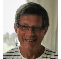
Gustav Cederberg