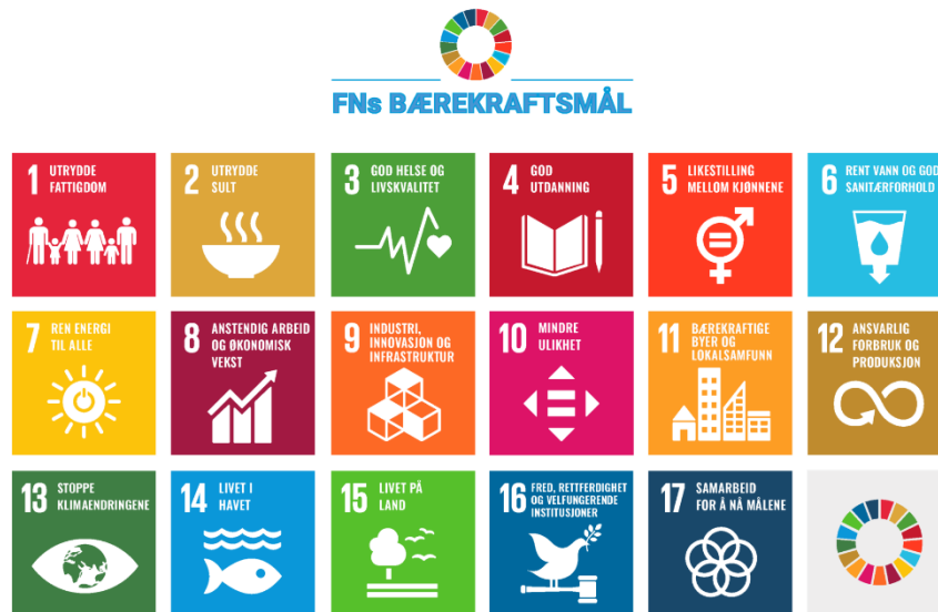
Figur 2: FNs bærekraftsmål.