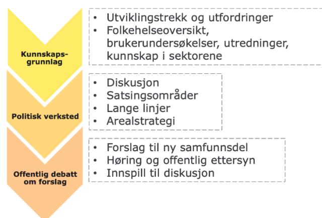
Figur 3: Foreslått prosess for revisjon

Følgende avsnitt gir en oversikt over temaer til utredning som del av prosessen med revisjonen, hensikt og metode for utredningene. Øvrige grunnlag for kunnskapsgrunnlaget nevnes under 3. Planprosess. Det er tatt utgangspunkt i utredningstemaer som beskrevet i Status og utfordringer i Planstrategi 2024-2028. Det er i tillegg lagt til enkelte temaer det er behov for å utrede i tråd med nye statlige planretningslinjer 2 og temaer som får økende aktualitet fremover.